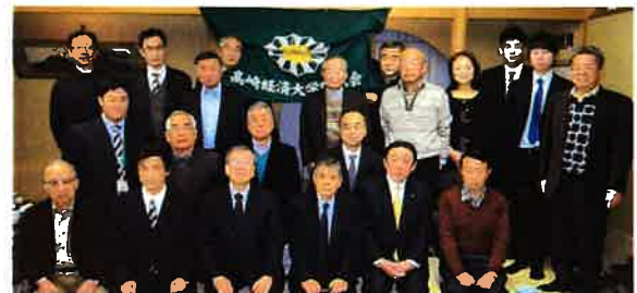
第17回総会 平成26年12月6日