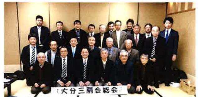
第21回総会 平成30年12月8日