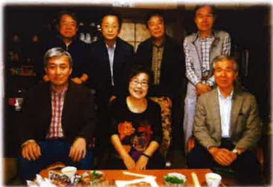
(平成29年 下宿先を訪問)

そんな家庭的な関係もあり2年前北海道に住む先輩の呼びかけで当時の下宿生が集まり、大家さん宅を訪問し旧交を温めることができました。高経大のいいところは、大学周辺に下宿が点在しており、夜な夜な各下宿の友人、先輩たちとの交流が出来た点にあると思います。都会地の大学では絶対に体験できない濃密な時間を過ごすことが出来ました。