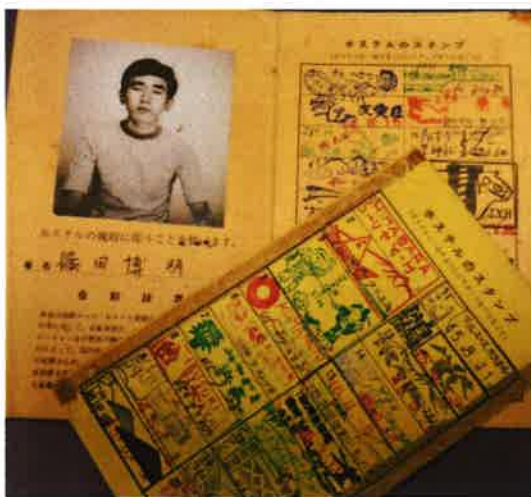
(ユースホステル 旅して廻りました)