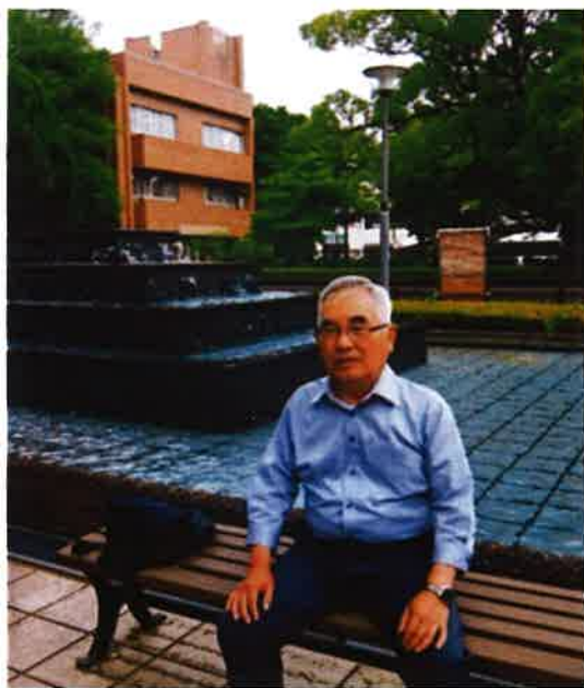
(図書館前の噴水にて)

旧高崎競馬場跡は国際会議場として立派なコンベンションセンターとなり駅からコンベンションセンターまで一直線に高架の歩道橋の工事が進んでおり本当に時がたったなと実感しました。