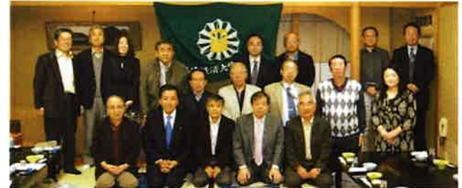
第13回総会 平成22年11月6日