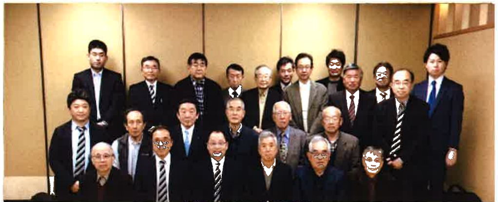
和気あいあいと情報交換