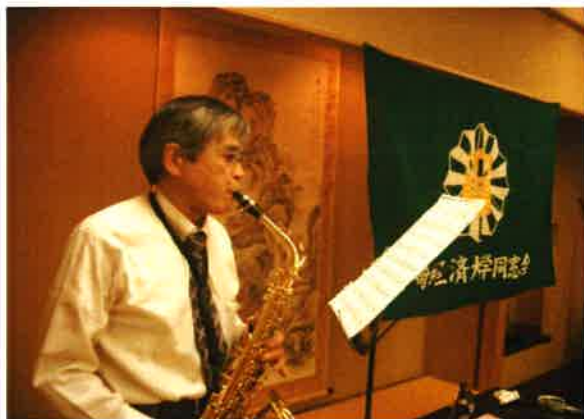
(サクスの名？演奏を披露)

だが、不思議なことに大学生の英語力は我々の時代と比べるとさして向上していないとの事。