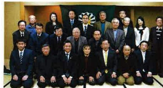
第15回総会 平成24年12月8日