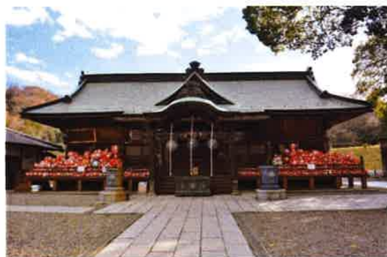
(ランニングの目標地点? 達磨寺)