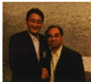
(ソニー 平井社長と)

入社後、食品売場、小型店店長を経験し家電製品部門が一番長かった。そんな中、ソニーの平井一夫社長(当時)とお話する機会もあり有意義であった。