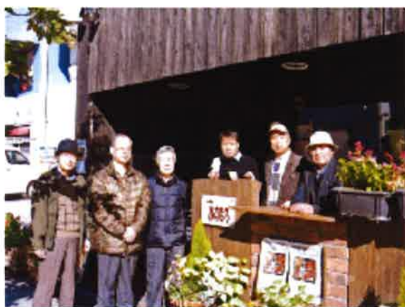
(あすなるの前で・写真は2年前)

卒業後もクラブやゼミの全国の友人達と連絡を取り合い、各地を旅行したり交流を続けています。先日も群馬の友人と赤城山に登り、夕刻には高崎市内の思い出多い喫茶「あすなる」に行きました。