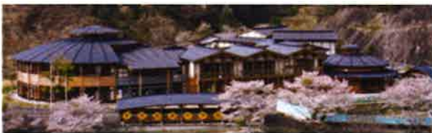
(宇目緑豊中学 同校HPより)

その時はまさか私が大分県で仕事をするとは予期していませんでしたので、旅行に行く時の参考にしようと懸命に聞いていた気がします。