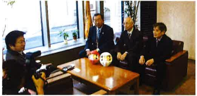
(大分合同新聞社を訪問)

高崎経済大学長が来社 高崎経済大学(群馬県高崎市)の石川弘道学長(顔写真)が7日、同窓会大分支部の会合のため来県し、大分合同新聞社を訪れた。石川学長は「公立大学としてあまり知られていないが、卒業生は全国各地で活躍。入学試験は福岡県でも実施しており、地域づくりなどに関心がある学生は進路選択の一つとして考えてほしい」と話した。同大学は1957年開校。経済と地域政策の2学部があり、学生は約4千人、卒業生は3万人に上る。