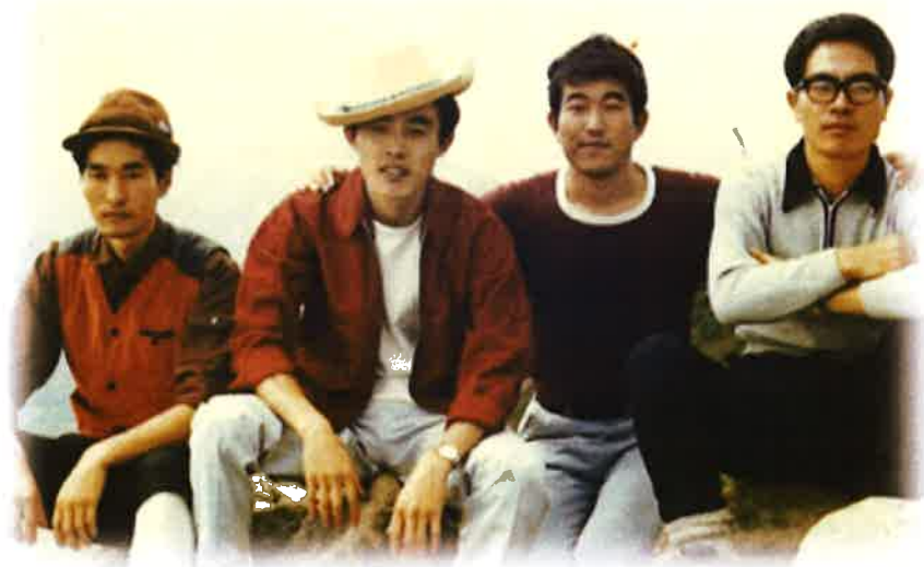
(尾瀬の至仏山にてバレー部の仲間と)

特に、4年生でクラブの現役を引退してから後は富士山や北岳、槍ヶ岳、穂高岳など多くの山を登り、それ以降登山が私の趣味の一つになっている