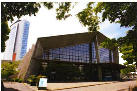
(群馬音楽センター)