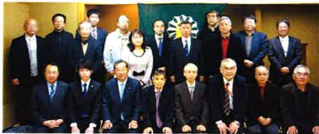
第16回総会 平成25年12月7日