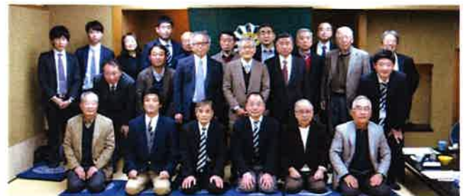
第19回総会 平成28年12月3日