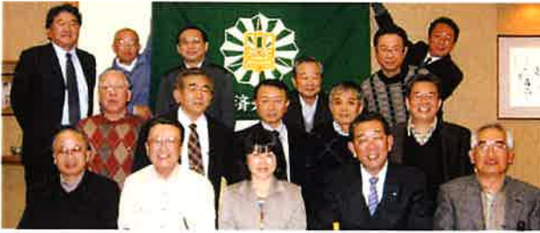
第10回総会 平成19年11月24日