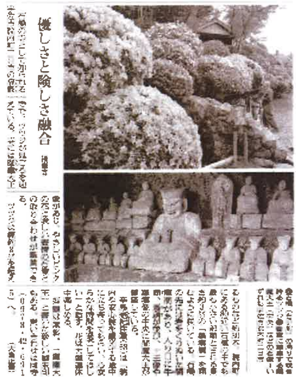
(朝日新聞 平成31年4月29日 掲載)

また、拙寺には珍しい閻魔洞（正徳二年・一七一二二年作）や石橋『羅漢橋』（江戸時代末期作）があり、四季折々の花も楽しめるように心がけています。