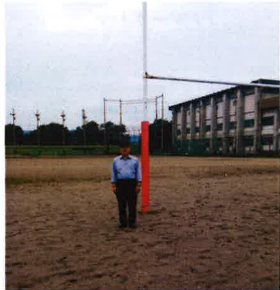
(思い出多き ラグビー場にて)

今回、母校では学生課を訪ねた後、構内を見て回りました。時を経て、当然のことですが設備も整い快適な学生生活を送れる環境がうらやましく思いました。ラグビー部のグラウンドに立ち、特に感慨深いものがありました。