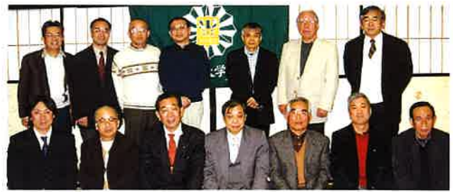
第11回総会 平成20年11月29日