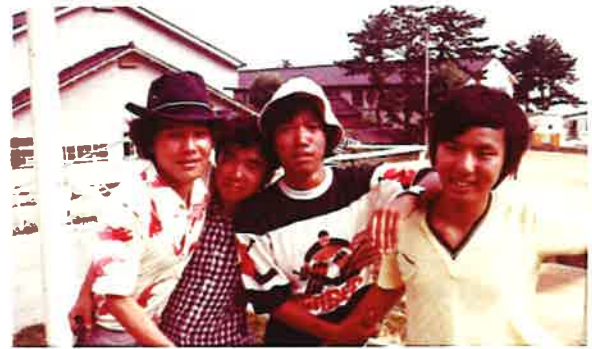
(会計研の仲間と合宿先にて)

一部の公認会計士、税理士を目指す人達が、受験に繋がる実践的な学習を集中して行うべきと主張し、合宿先の諏訪湖畔の旅館で夜を徹して大激論（学生のあるべき姿とはとか今本当に取組むべきものはなにかなど）を繰り返して、結果実学重視のグループは新たに経理研究部を設立し、分裂することになりました。