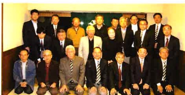
第20回総会 平成29年12月2日