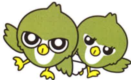
たかまる・このみん (高経大 マスコット・キャラクター)

卒業生として恥ずかしくないように、今後とも、頑張ってもらいますので、お近くにお寄りの際はお気軽に(笑) お立ち寄りください。