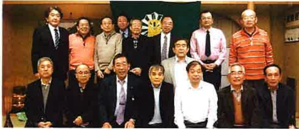
第12回総会 平成21年11月28日