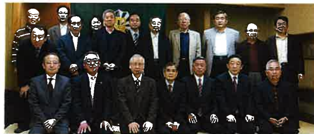
第14回総会 平成23年11月19日