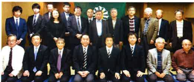
第18回総会 平成27年11月7日